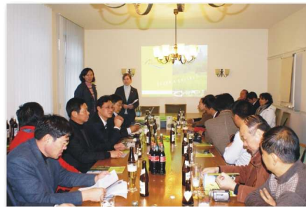
9、在德国马尔堡市听取其经济发展情况介绍