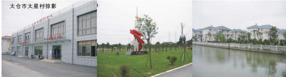
太仓市太星村掠影