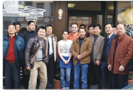
7、学习考察团在德国安得斯堡市考察间歇，在当地一家餐厅用餐后，应邀与店主夫妇合影