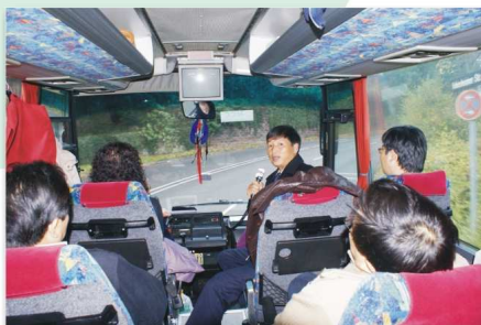
10、学习考察团以车厢作为“流动课堂”，畅谈学习考察体会