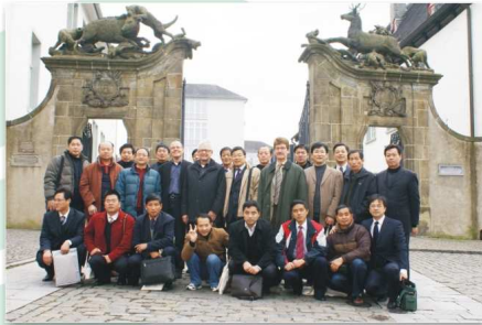
6、学习考察团与德国安得斯堡市官员在该市市标前合影