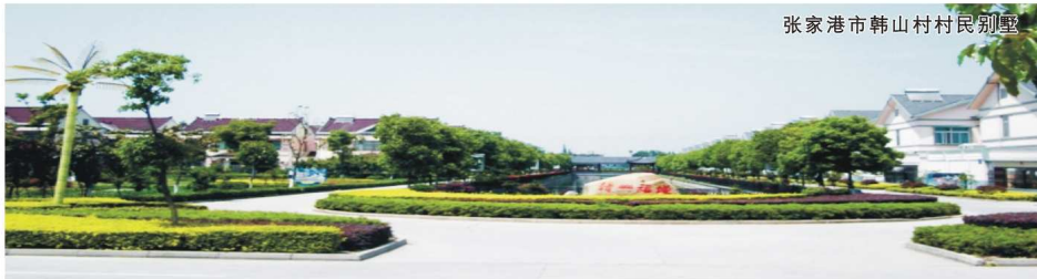
张家港市韩山村村民别墅