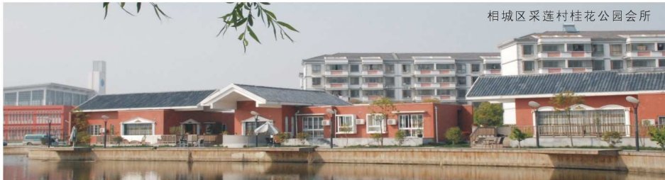
相城区采莲村桂花公园会所