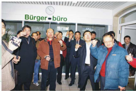
8、在德国马尔堡市，当地接待人员用当地土酒欢迎考察团