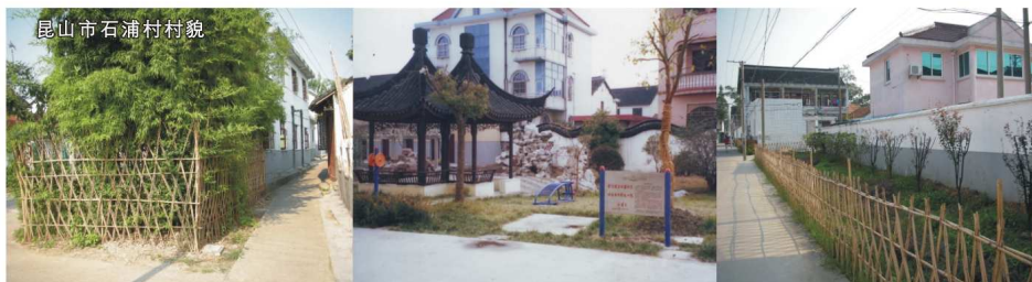
昆山市石浦村村貌