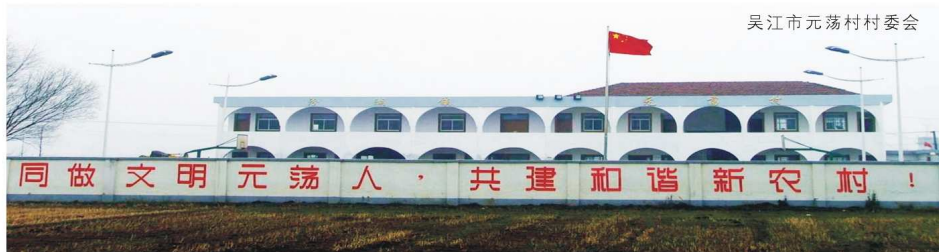
吴江市元荡村村委会