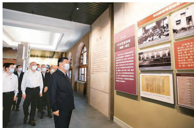
2021年9月13日至14日，中共中央总书记、国家主席、中央军委主席习近平在陕西省榆林市考察。这是14日上午，习近平在中共绥德地委旧址考察。