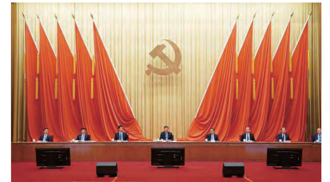
2021年2月20日，党史学习教育动员大会在北京召开。中共中央总书记、国家主席、中央军委主席习近平出席会议并发表重要讲话。

第五，深刻认识以史为鉴、开创未来的重要要求。“观今宜鉴古，无古不成今。”总结历史是为了使全党从历史进程中洞察历史发展规律和时代发展大势，提高认识水平和辨别