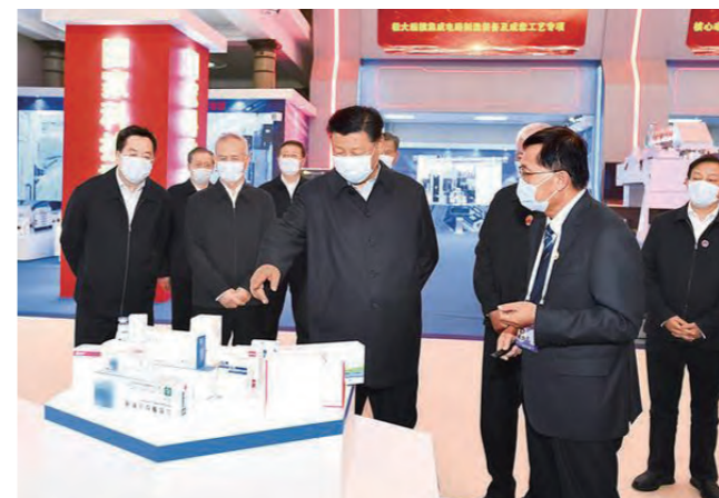
2021年10月26日，中共中央总书记、国家主席、中央军委主席习近平在北京展览馆参观国家“十三五”科技创新成就展。

的十八大以来，我们清醒认识到，新时代坚持和发展中国特色社会主义是一场艰巨而伟大的社会革命，各种敌对势力绝不会让我们顺顺利利实现中华民族伟大复兴。基于此，我向全党反复强调，必须进行具有许多新的历史特点的伟大斗争，必须准备付出更为艰巨、更为艰苦的努力，必须高度重视和切实防范化解各种重大风险。这几年，我们掌握应对风险挑战的战略主动，对危及党的执政地位、国家政权稳定，危害国家核心利益，危害人民根本利益，有可能迟滞甚至打断中华民族复兴进程的重大风险挑战，果断出手、坚决斗争，解决了许多长期想解决而没有解决的难题，办成了许多过去想办而没有办成的大事。对这个历程，我们大家都有亲身经历，这次全会《决议》作了充分概括。