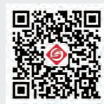
苏州干部学院公众号二维码