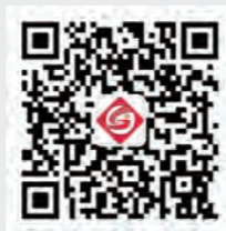
苏州干部学院公众号二维码