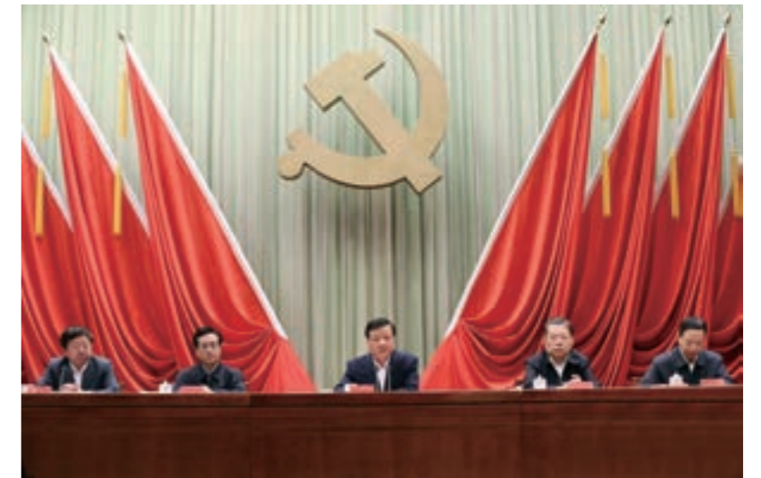
本文系中共中央政治局常委、中央党校校长刘云山在中央党校2016年秋季学期第二批入学学员开学典礼上的讲话

在增强核心意识上当好表率。 党的十八大以来，习近平总书记带领全党全军全国各族人民开创了中国特色社会主义伟大事业和党的建设新的伟大工程新局面，在改革发展稳定、内政外交国防、治党治国治军等方面取得了一系列具有重大现实意义和深远历史意义的成就，实现了党和国家事业的继往开来，赢得了全党全军全国各族人民衷心拥护，受到了国际社会高度评价赞誉。习近平总书记作为党中央的核心、全党的核心，是实