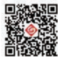
苏州干部学院公众号二维码

地 址 苏州市高新区狮山路 108 号 邮 编 215011 电 话 0512-69001100 (总机) 0512-68085345 (编辑部) 征 稿 邮 箱 jcgb@ngyjs.cn 网 址 www.ngyjs.cn