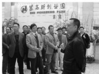
由国务院西部开发办公室组织实施，苏州市发展和改革委员会与我院共同承办的“西部地区发展地方经济专题研修班”于十一月月上旬在我院开班。共

有来自云南、广西、重庆、四川、贵州、青海、甘肃、宁夏、新疆等9个省、自治区和新疆建设兵团的100名来自发改、科技系统及企事业单位的科级以上领导干部，分两期参加培训。两期培训班历时半个月，学习内容比较丰富，主要内容有现代服务业发展与苏州实践；