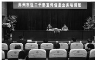
12月4-6日, 苏州市委组织部在我院举办组工干部宣传信息业务培训班。12月6日, 培训班结业典礼在我院召开, 市委组织部副部长金浩等领导出席了结

业典礼。此次培训班历时3天, 共有65名各市(区)、镇(街道)组工干部参加了培训。此次培训的主题是新形势下组工干部如何加强舆论宣传工作, 并围绕培训主题, 开设了“新形势下组织工作的舆论引导”、“如何做好新形势下组织部门信息工作”、“新形势下加强和改进党建宣传报道”、“党报新闻写作业务辅导”、“新媒体建设重点及发展趋势”、“贯彻十七届四中全会精神, 加强和改进新形势下组织工作舆论宣传”等辅导课程。