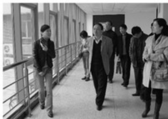
11月27日,由孙坚烽副院长带队,院第三党支部前往位于独墅湖高教区的苏州大学功能纳米与软物

质(材料)实验室(FUNSOM)参观学习,调研苏州转型升级和创新型经济的发展。功能纳米与软物质(材料)实验室依托于苏州大学,在苏大多个学科优势的基础上,由李述汤院士率领其科研团队加盟而组建,开拓具有国际先进水平的、有创新及特色的研究方向,其目标是获得性能优异的功能纳米与软物质材料和器件,并拥有自主知识产权,研究成果达到国际先进水平。通过参观学习, FUNSOM实验室在科研领军人物的建设、交叉学科高级复合人才和学术梯队的培养、产学研一体化以及高新技术经济增长点培育等方面的创新思路和先进经验让大家深受启迪。