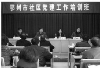
12月2日, 鄂州市社区党建工作培训班一行47人在鄂州市市委常委、组织部长马在学同志带领下来到我院