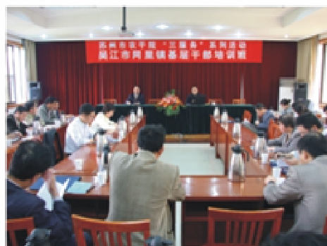
4月29日，扎实为结对同里镇服务，学院成功举办吴江同里镇基层干部培训班