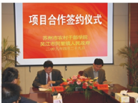
4月29日，学院与吴江市同里镇隆重举行学习实践活动“三服务”工作项目合作签约仪式