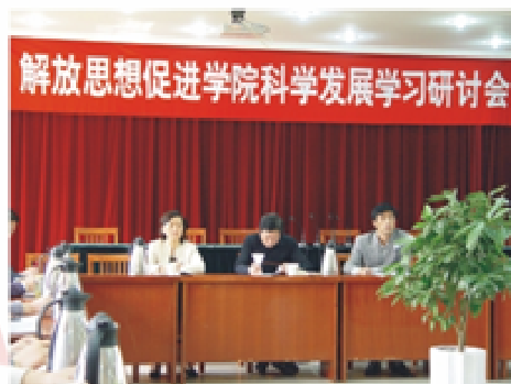
4月22日，学院举行“解放思想促进学院科学发展学习研讨会”