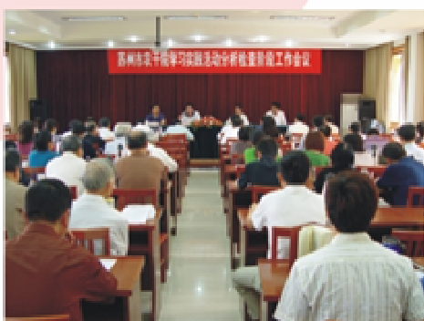
5月18日，学院召开学习实践活动分析检查阶段工作会议